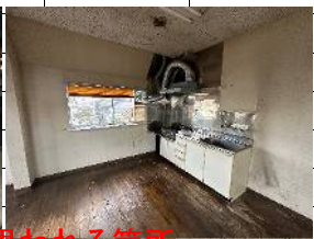
雨漏りと思われる箇所

すべての設備等は現況貸しとなります。 汚れあり 使えない箇所設備あり、雨漏り数か所あり 浄化槽費用折半負担(4年後位に下水道に切替予定) 電気メータは借主が決まってから設置します。 200Vは使用する場合は、自己負担 水道メータは借主が決まってから設置します。 ガス設備は入退去時ガス会社と相談となります。 退去時現況程度に要片付 借家人賠償2000万加入必須 (保険会社紹介します。) 駐車場:5~6台可能(ロープ内) オーナーはインボイス登録していない為、消費税の仕入れ控除はできません。