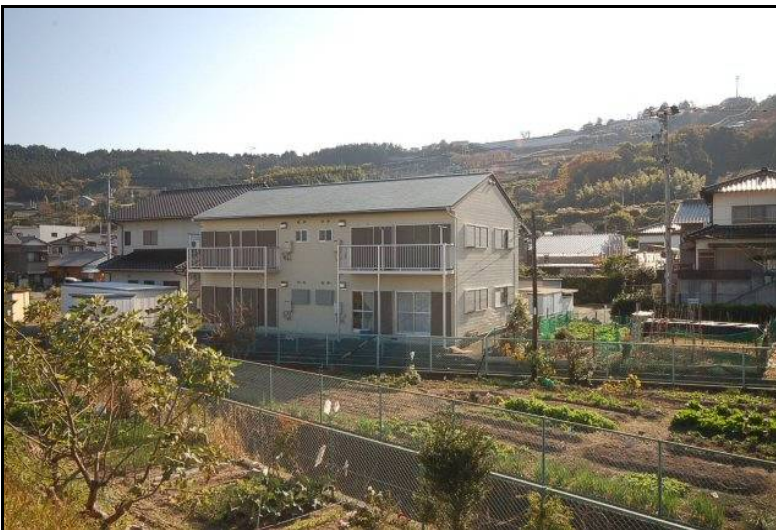
玄関側から見て左から101号